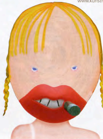
artotheek, 6.3.-29. April 2008, „HOOP!“

Unter Fettenhennen 19, gegenüber Dom, D3, www.koelntourismus.de