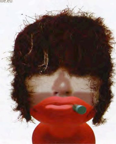
© Heike Kati Barath und C.A. Wertheim